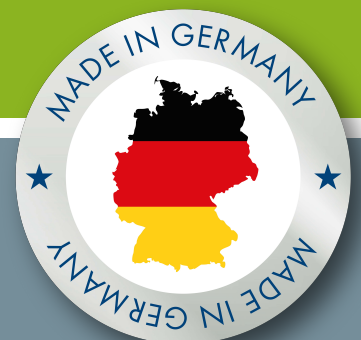
Moralt LAMINESSE Klassik MDF