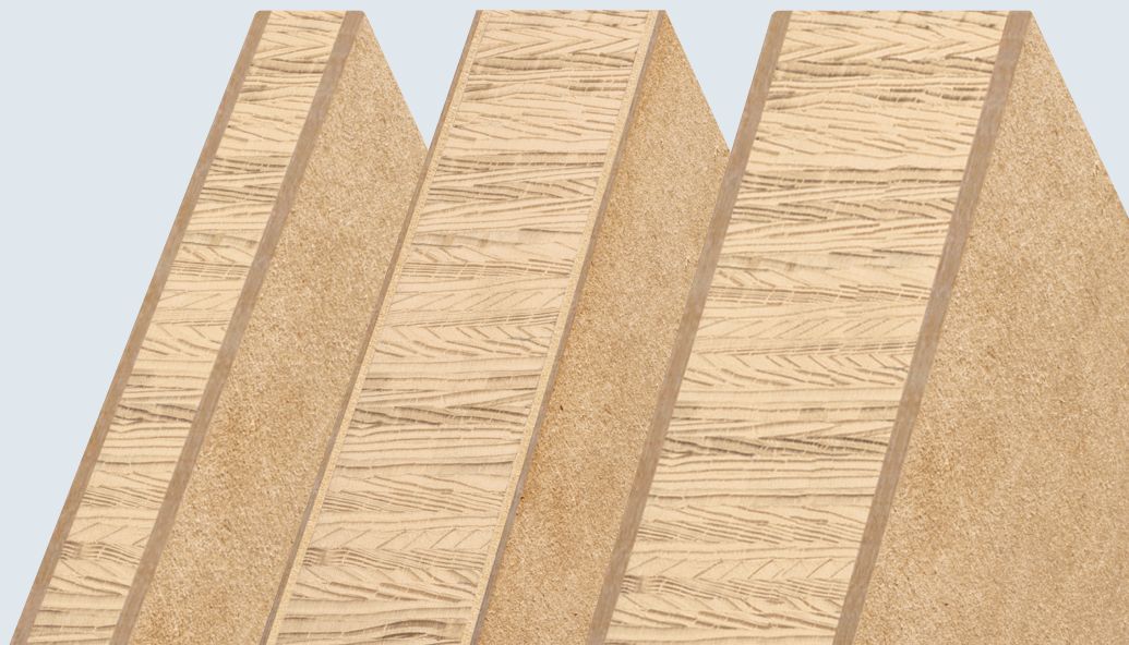
Moralt LAMINESSE Klassik MDF